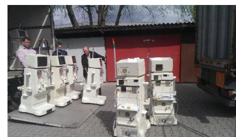
Erneute Sendung eines Seefrachtcontainers mit medizinischen Hilfsgütern nach Syrien