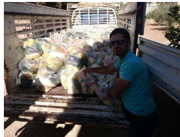
Verteilung von Ramadan-Lebensmittelkörben in Syrien