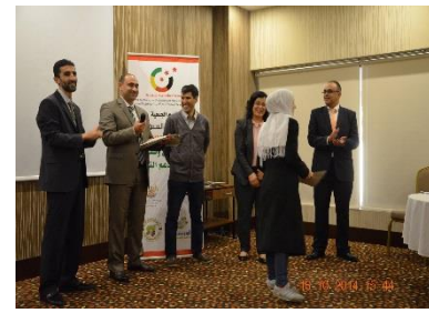
Organisation einer Weiterbildung für syrische Psychologen in Gaziantep