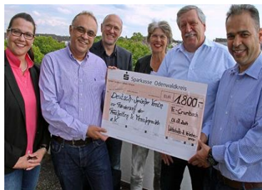
Teilnahme an der Benefizveranstaltung "Mit den Augen im Spiegel der Seele" in Fränkisch Crumbach