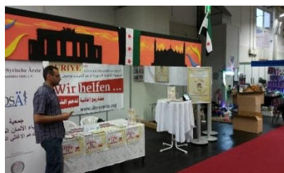
Stand beim Festi-Ramazan in Dortmund