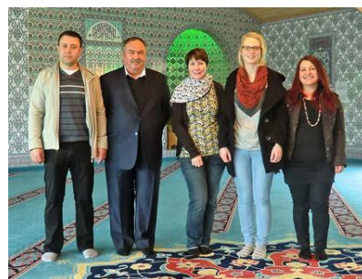
Der Türkisch-Islamische Kulturverein Fürthen startet die Aktion "Hoffnung für syrische Kinder" und sammelt Babynahrung für den DSV