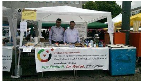
Teilnahme am Internationalen Bürgerfest in Darmstadt