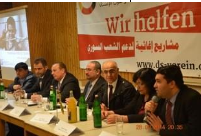
Treffen mit der syrischen Übergangsregierung in Dortmund