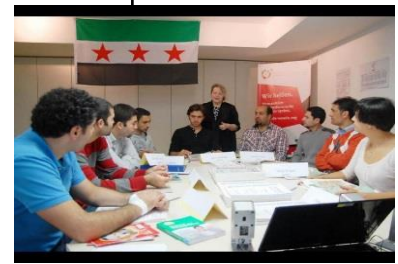
Deutschkurs für syrische Flüchtlinge aus Darmstadt