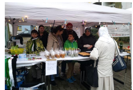
Stand bei „Treffen unter dem Weihnachtsbaum“ in Darmstadt-Eberstadt