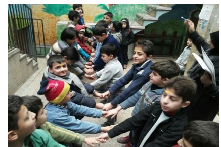
Unterstützung des Aufbaus eines Kinderzentrums in Aleppo